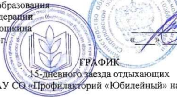
ГРАФИК 15-дневного заезда отдыхающих в ГАУ СО «Профилакторий «Юбилейный» на 2025 год